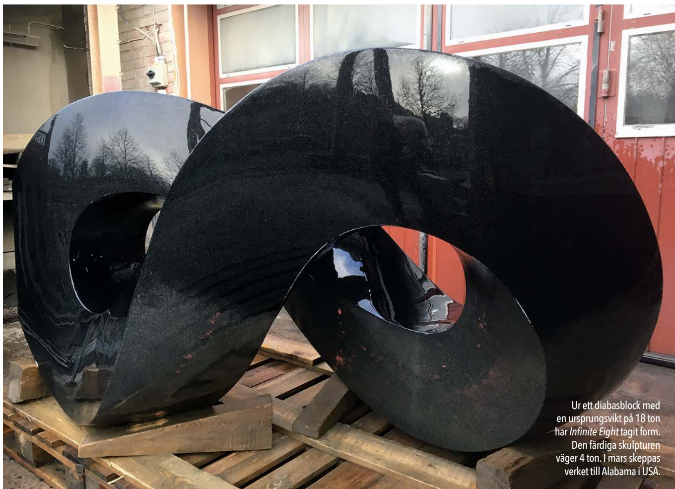
Ur ett diabasblock med en ursprungsvikt på 18 ton har Infinite Eight tagit form. Den färdiga skulpturen väger 4 ton. I mars skeppas verket till Alabama i USA.