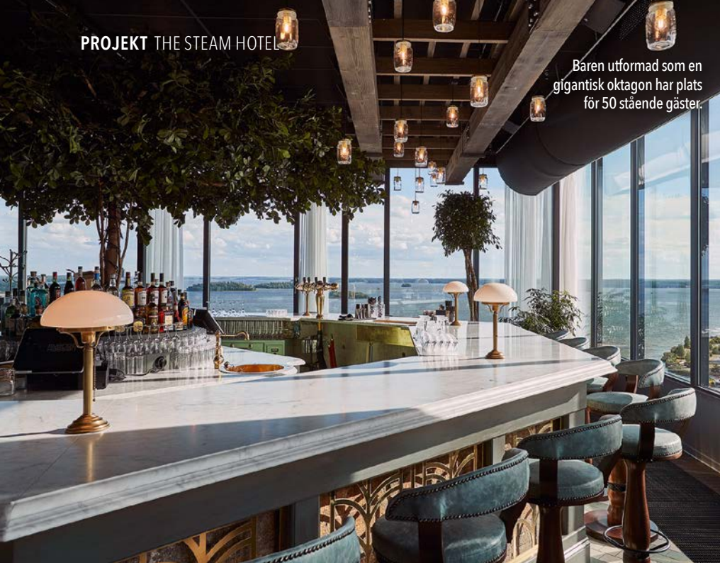
Baren utformad som en gigantisk oktagon har plats för 50 stående gäster.