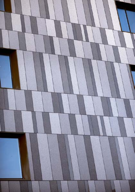
▲ Kvarteret Bokbindaren i Linköping har fasad i Tossene Grå Bohus.