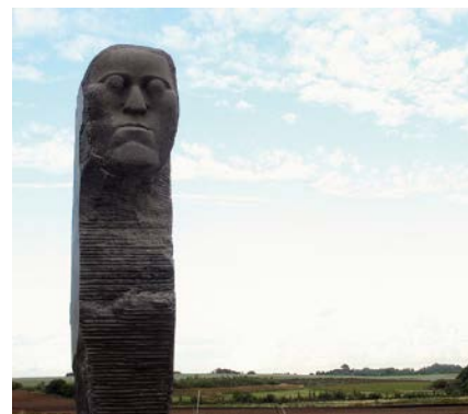
▶ Det danska konstprojektet Dodekalitten är ett slags modernt Stonehenge med skulpturer i bland annat Grå Bohus.