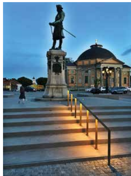
▲ Ett mässingsräcke med infälld belysning leder vägen upp för trappan som en final på den långa barockaxeln.