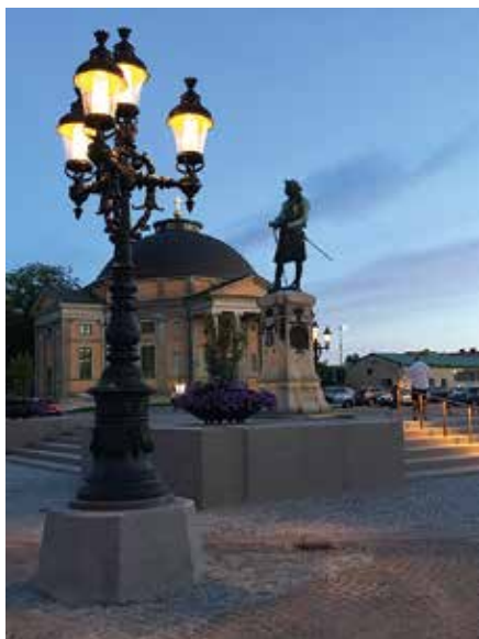
▲ Kandelabrarnas lyktor byggdes om med ljuskällan placerad dold i taket.