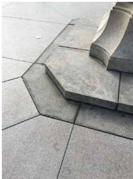
▲ Ett mästarprov - varje granitblock är måttsatt för situationen.