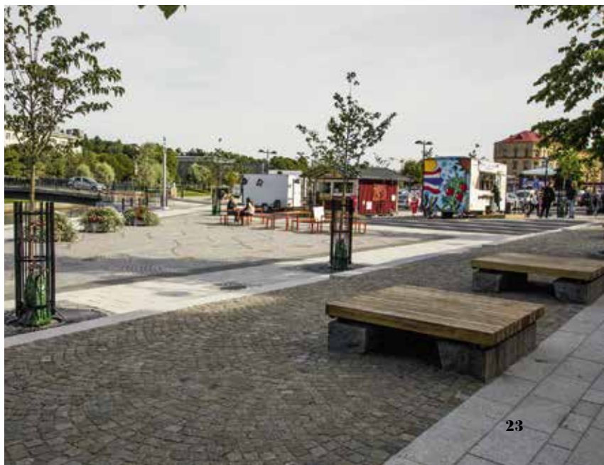
Fisktorget. Bänkarna är av återvänd kajkrönsten och ek.