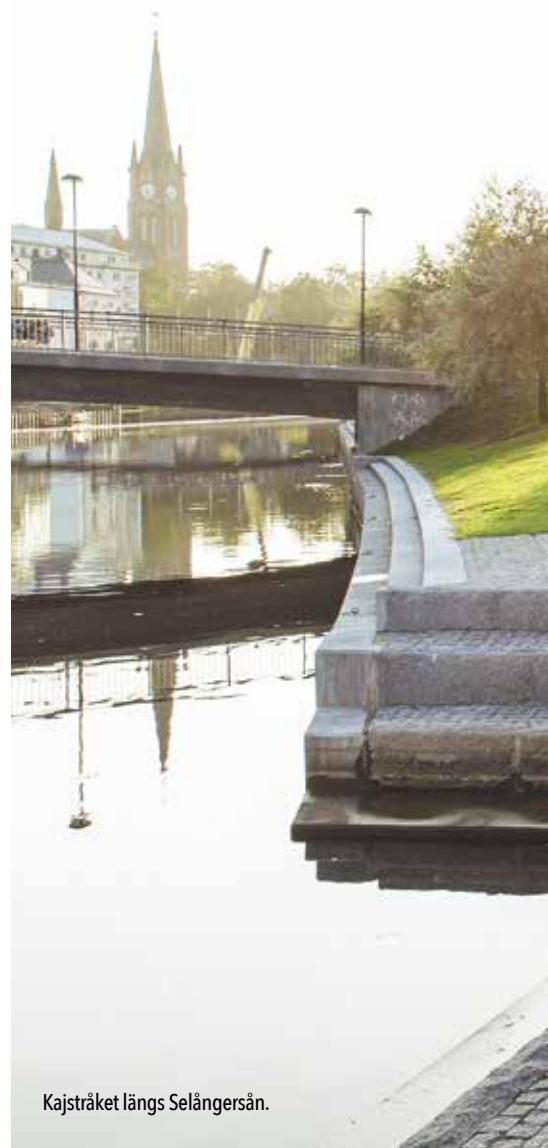
Kajstråket längs Selångersån.

– Där har vi använt en mix av kinesisk, portugisisk och svensk granit samt finländsk diabas. ■