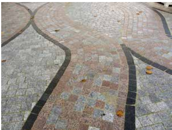
Flammad smågatsten har lagts i böljande mönster på Fisktorget.