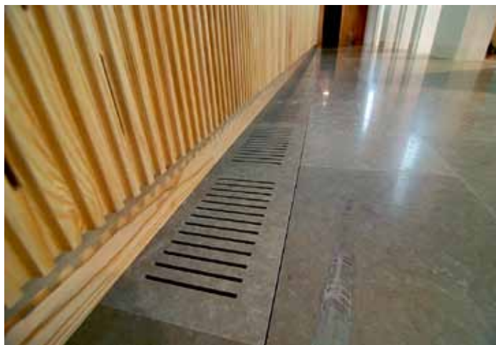
▲ Unik lösning. Frästa spår i kalkstensplattorna ger fullödig ventilation.