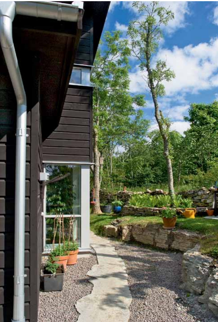
Gångarna består av normalhyvlade kalkstensflisor.