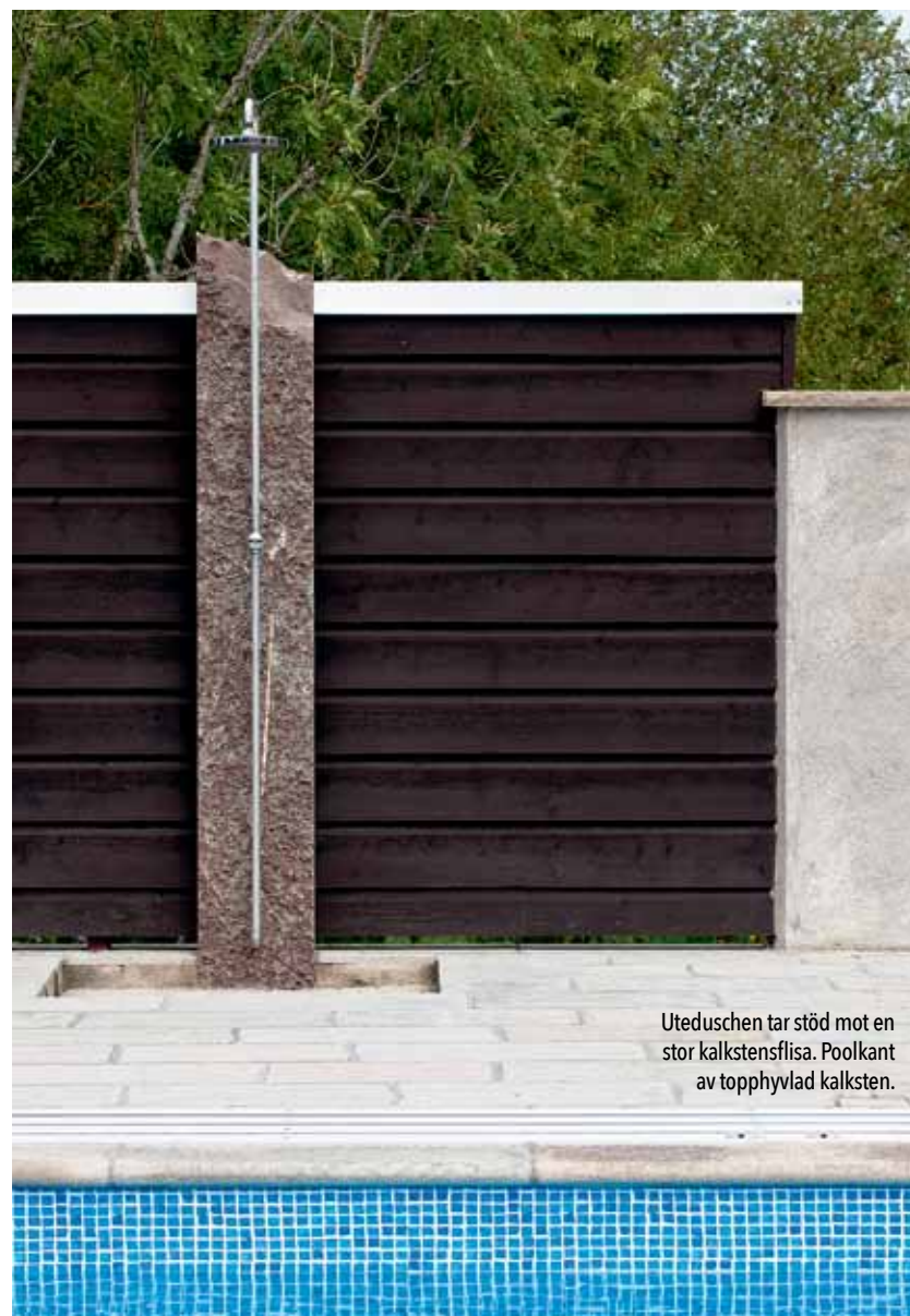
Uteduschen tar stöd mot en stor kalkstensflisa. Poolkant av topphylvad kalksten.

ETT STENKAST FRÅN Borgholm, i en sluttning upp mot landborgskanten, ligger ett Fågelfors-typhus från 1927. Omgivet av lummig grönska och med kalkstensflis delvis blottad i dagen, kan man från det lite nationalromantiska faluröda huset skymta Kalmar sund. Det är en idyll, som när vårgrönskan gör sin entré nästan kan liknas vid en öländsk regnskog.