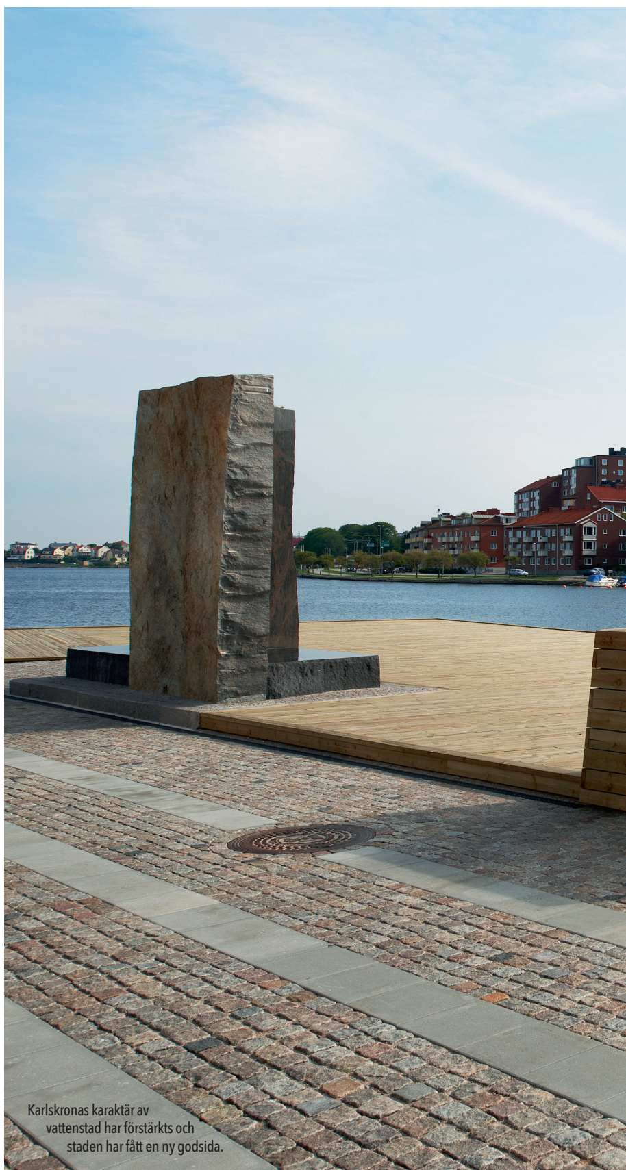
Karlskronas karaktär av vattenstad har förstärkts och staden har fått en ny godsida.