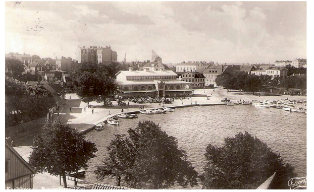
Saluhallen (riven sedan länge) och Fisktorget anno 1935.