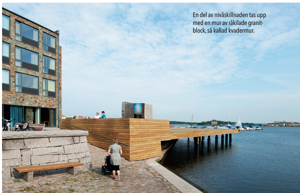
En del av nivåskillnaden tas upp med en mur av råkålade granitblock, så kallad kvadermur.

Ett sådant tillfälle öppnades när det bestämdes att bygga ett hotell nere vid vattnet. Det gav möjlighet att ge Fisktorget ett socialt innehåll och hotellet skulle hjälpa till att befolka platsen. Projektet som invigdes 2011 tar inte hela torget i anspråk men skapar ändå en ny attraktiv plats nere vid vattnet. Det är ett relativt litet projekt som emellertid betyder mycket för sin stad. Karlskronas karaktär av vattenstad har förstärkts och staden har fått en ny godsida.