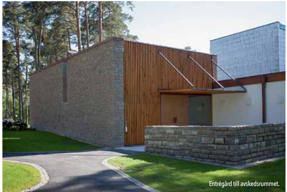
Entrégård till avskedsrummet.