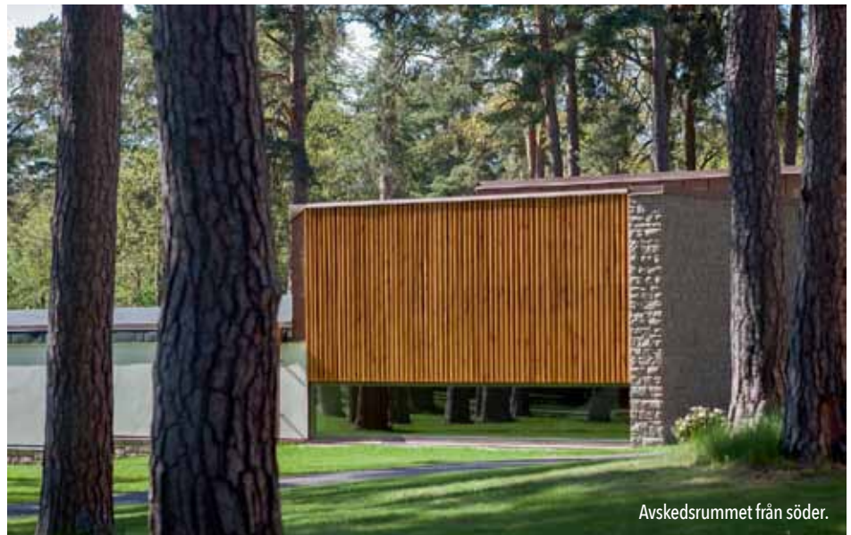
Avskedsrummet från söder.

DET BÖRJADE 2006 som en skiss för ett skärmtak. Vi var i färd med att rita nya förvaltningsbyggnader till Norra Kyrkogården i Kalmar där Heliga Korssets kyrka och krematoriet ligger alldeles intill. Vi tog en promenad och tittade.