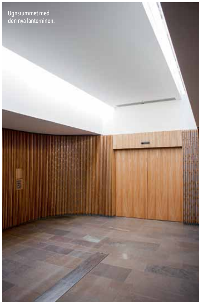
Ugnsrummet med den nya lanterninen.