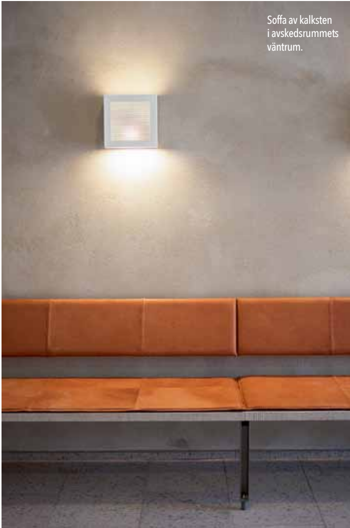
Soffa av kalksten i avskedsrummets väntrum.