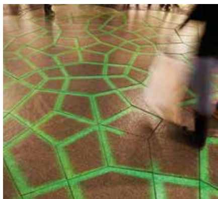
Mönsterläggningen får liv på kvällen när den blir en del av effektbelysningen.

”Mönstret är en röd tråd i gestaltningen och går även igen i utformningen av den uppvärmda sittskulpturen i polerad diabas och de färgväxlande led-armaturer som tagits fram speciellt för Kullagatanprojektet.”