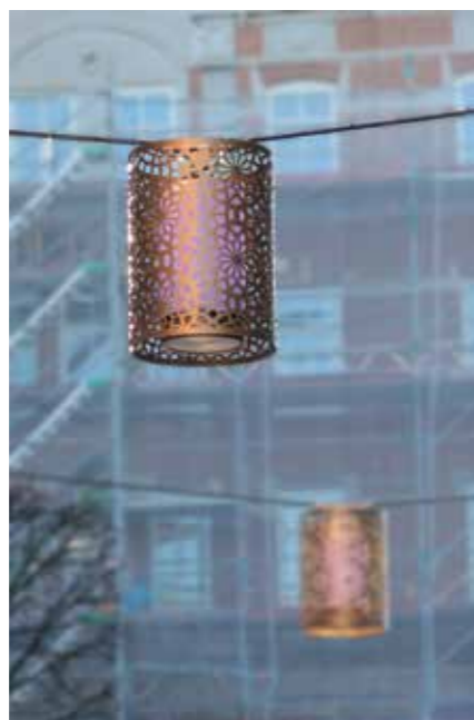
Kullagatans armaturer är specialutvecklade för gågatan i samarbete med Atelje Lyktan.

STENLEVERANTÖR Zaar Granit AB Stenia, www.stenia.se