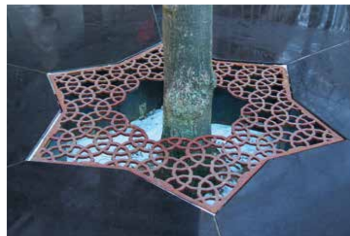
Sittskulpturen i polerad diabas omgärdar ett befintligt träd skyddat av ett mönstrat trädgaller.