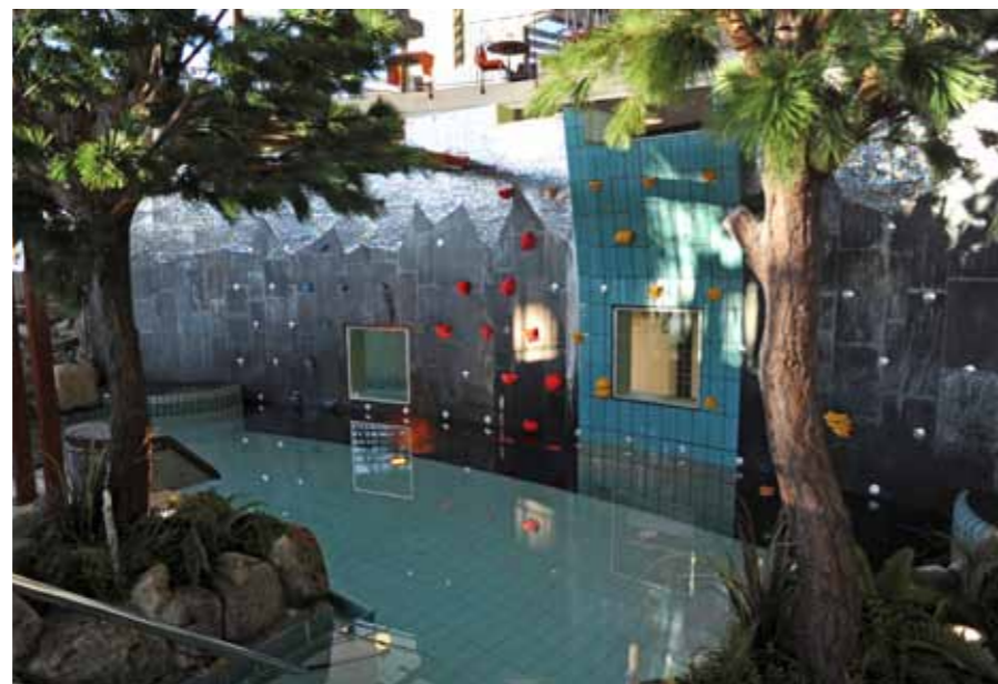
Klättrväggen på Himlabadet är uppbyggd av skiffer med kloyta. Ett grepp som ger klättraren känslan av att vara ute på en riktigt bergsbestigning.

STENLEVERANTÖR Borghamns Natursten AB Nordskiffer