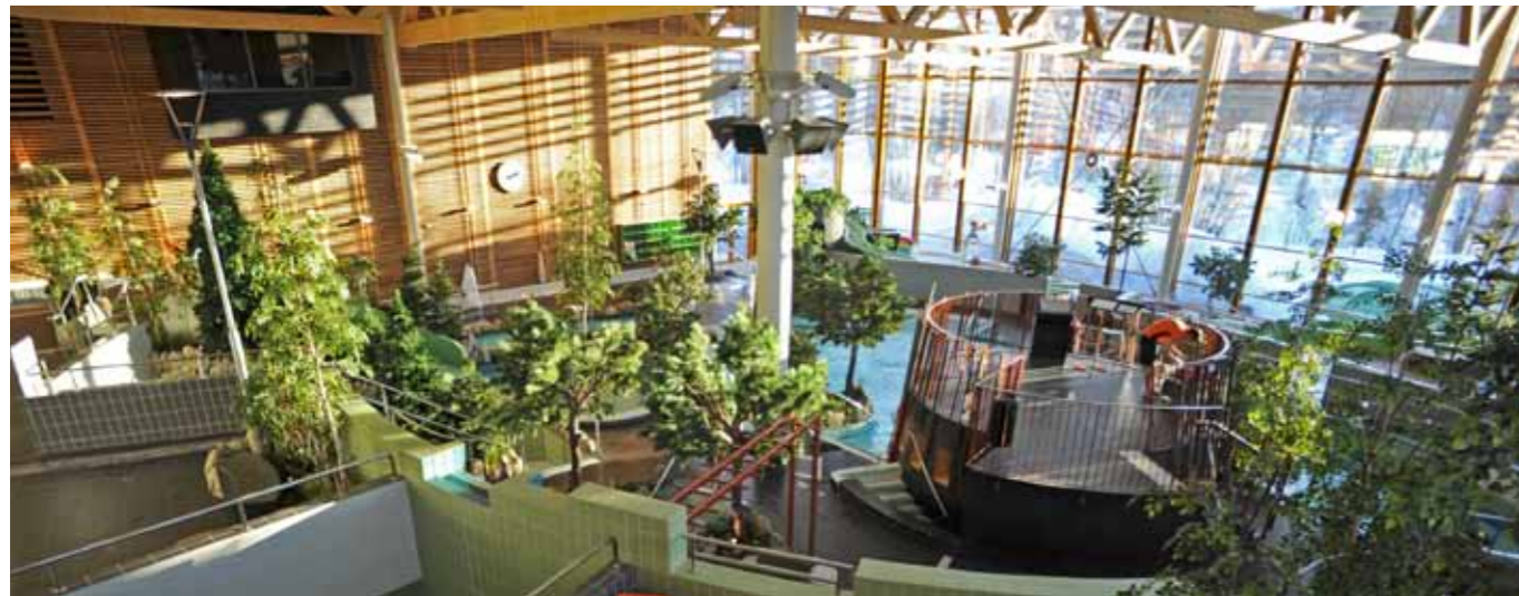
Äventyrsbadets växtlighet är likt en medelpadsk skog med ormbunke, björk och tall.

har en långsiktig hållbarhet. Kvaliteter som naturmaterialet sten besitter.