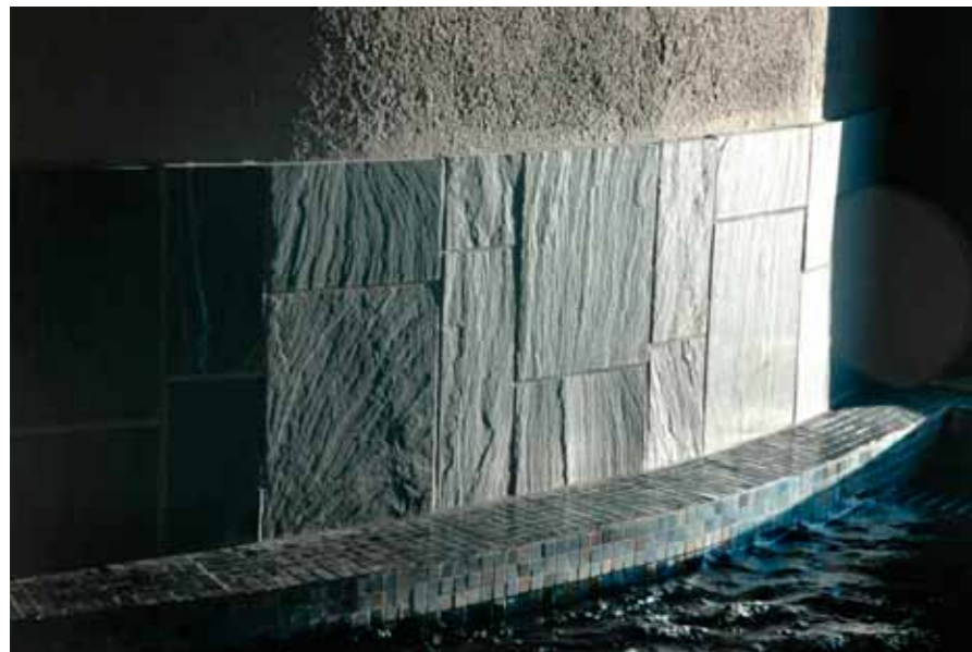
Skiffers klovyta bidrar till att uppfylla intrycket av rå natur.

bär trä, timmer och sten som ingående element. Bassängrummens träpaneler ger associationer till en brädgård och äventyrsbadets växtlighet är likt en medelpadskskog. Klättermurens skiffer för tankar till berg och varmpoolen är utformad som en glödande kolmila. Temat går igen i färgsättning och materialval, naturstenen på golv i relaxavdelning, foajé samt sittbänkar med gedigna skifferhällar känns självklara. Himlabadets foajé välkomnar besökaren med golv av vacker Brännlyckemarmor, som även är en koppling till sporthallfoajéns marmorgolv.