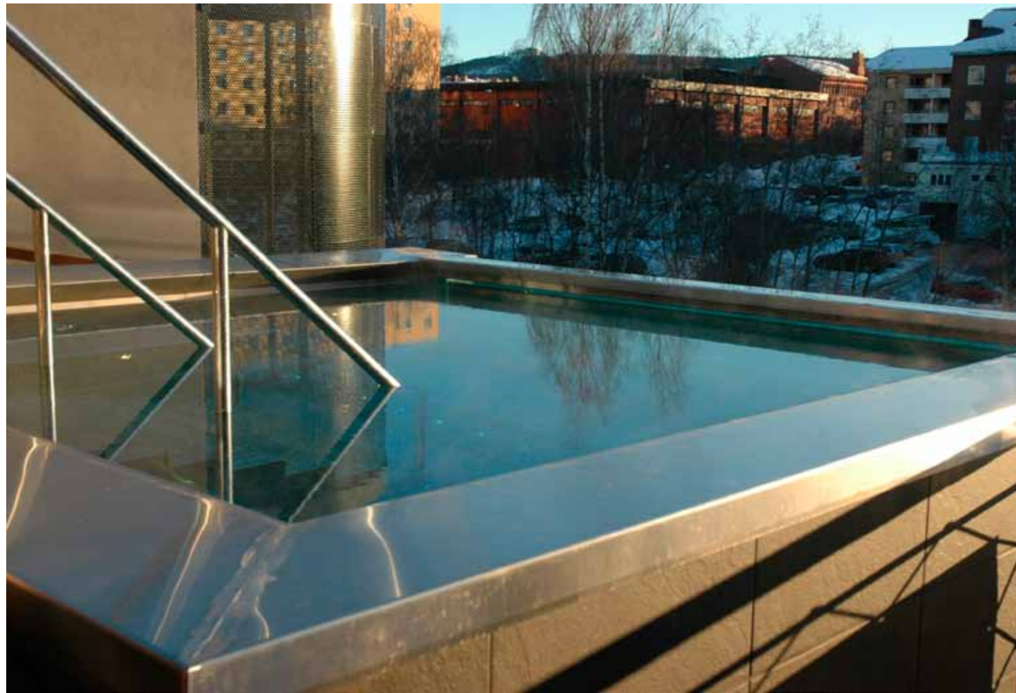
På relaxavdelningens takterrass har varmpoolen utsikt över Selångersån.